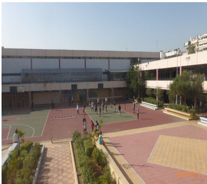
Άποψη του προαυλίου μας

Πρόνοιας-Ευεξίας περιλαμβάνει τις ειδικότητες: Αισθητικής Τέχνης, Β. Ακτινολογικών Εργαστηρίων, Β. Ιατρικών και Βιολογικών Εργαστηρίων., Κομμωτικής Τέχνης, Β. Νοσηλευτών, Β. Βρεφονηπιοκόμω.