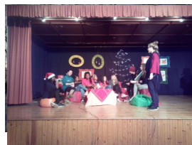
Από τη Χριστουγεννιάτικη γιορτή μας

Η φετινή χριστουγεννιάτικη γιορτή του σχολείου μας είχε χρώμα από όλον τον κόσμο. Οι μαθητές του σχολείου μας, μαζί με τους υπευθύνους καθηγητές, διοργάνωσαν μια πολύ όμορφη γιορ-